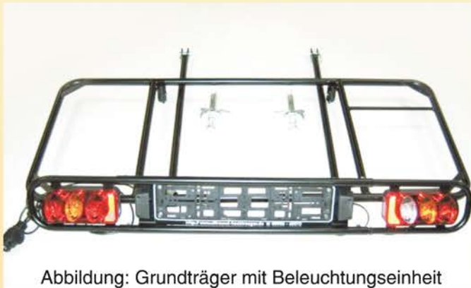
Abbildung: Grundträger mit Beleuchtungseinheit